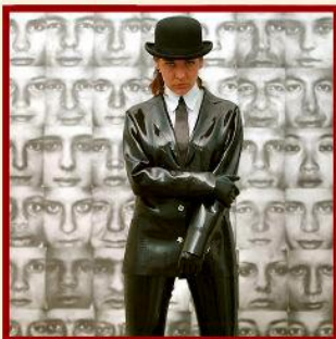
Classic suit in pinstripe I