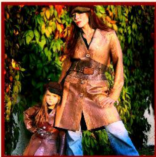
Coats in wild thing latex