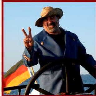
Captain's Colani in velvet latex