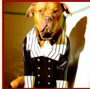
Classic suit for our dog