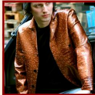
Jacket in beautiful beast