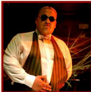
Waistcoat in pinstripe II