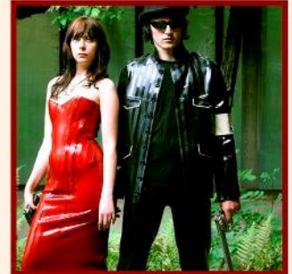
Outfits in pinstripe II