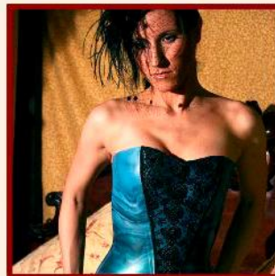
Corsage with Lace