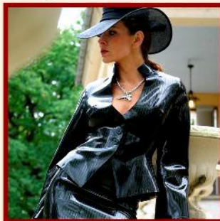
Ladies' suit in pinstripe I