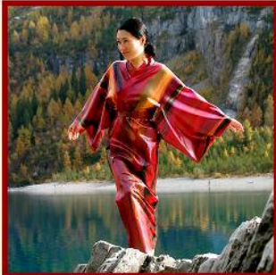
Kimono in mixed colors